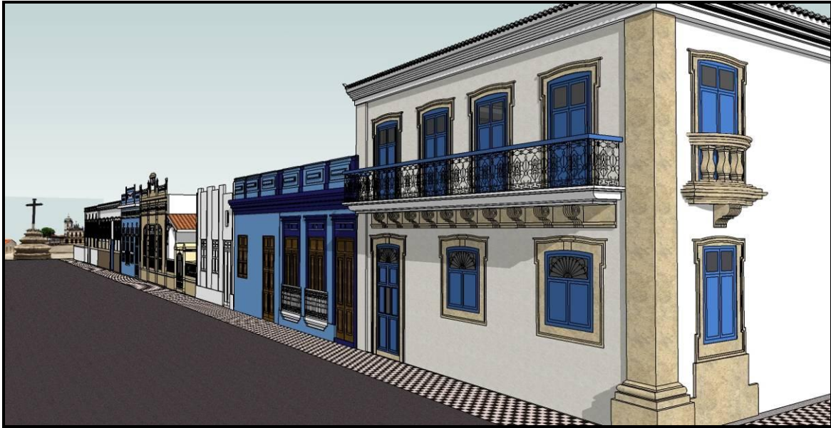
Figura 03: Imagem da maquete eletrônica do Sobrado Conselheiro Henriques e edificações vizinhas.