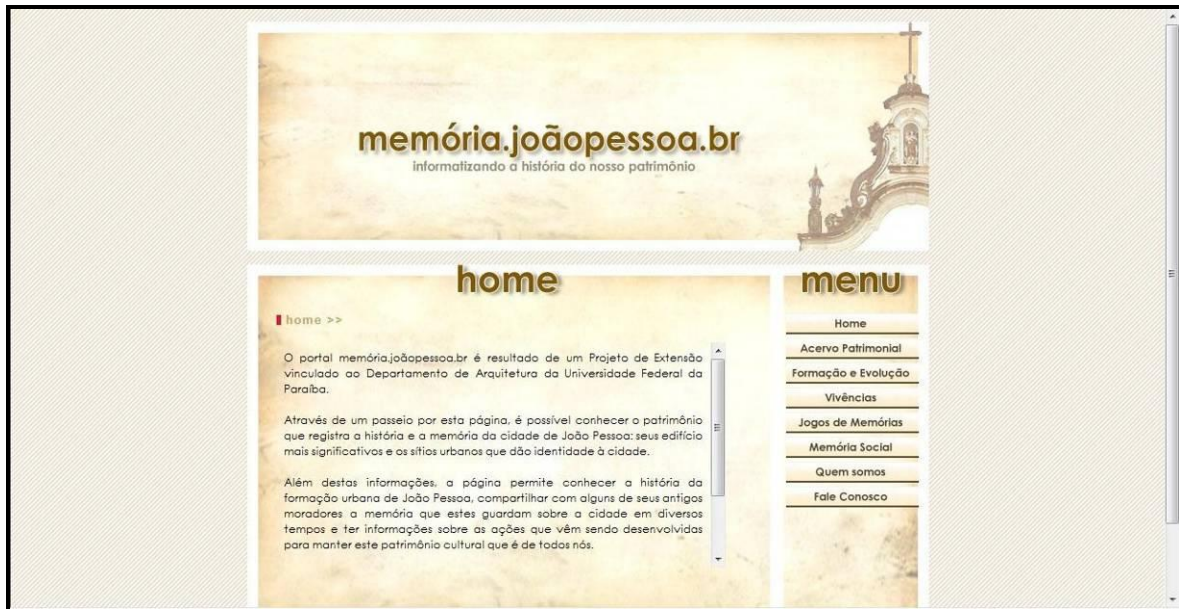
Figura 06: Imagem da página de apresentação: Home .

Para a equipe de extensionistas, o trabalho de elaboração e montagem desta página se mostrou positivo, pois além de proporcionar-lhes uma visão mais clara sobre o patrimônio da cidade de João Pessoa, as motiva com a consciente participação em uma ação de educação patrimonial e as coloca diante de novas ferramentas de trabalho com as quais não haviam tido nenhuma experiência anterior.