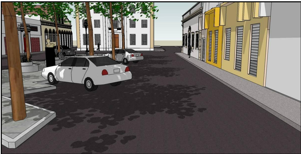
Figura 04: Imagem da maquete eletrônica da Praça Rio Branco.

Tanto os vídeos quanto os jogos foram apresentados a alunos da graduação do curso de Arquitetura, em que a resposta foi motivadora, despertando o interesse dos alunos que contribuíram com observações pertinentes para enriquecer o trabalho. Efetivar o conhecimento através da curiosidade é a premissa desse novo instrumento de educação patrimonial.