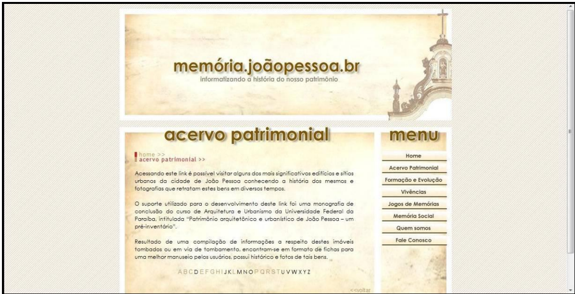
Figura 01: Imagem do conteúdo do link “Acervo Patrimonial”.